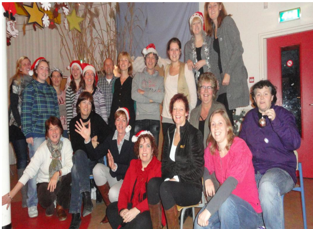
Namens het team van de Nijenoord